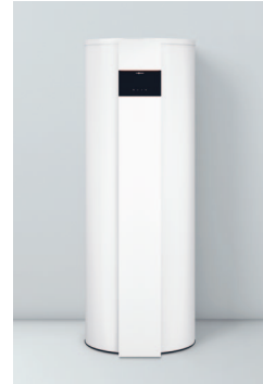
Vitocal 262-A typy T2E-R290/T2H-R290

Treści chronione prawem autorskim. Kopiowanie i rozpowszechnianie tylko za zgodą posiadacza praw autorskich. Zmiany zastrzeżone. Grafiki produktów przedstawionych w niniejszej ulotce są poglądowe i nie stanowią oferty w rozumieniu przepisów Kodeksu Cywilnego. Rzeczywiste produkty i barwy mogą różnić się od prezentowanych w prospekcie.