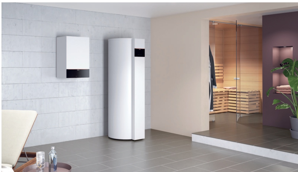
Pompa ciepła do podgrzewu c.w.u. Vitocal 262-A z wiszącym gazowym kotłem kondensacyjnym Vitodens 200-W

Pompa ciepła do podgrzewu c.w.u. Vitocal 262-A wykorzystuje ekonomicznie i energooszczędnie ciepło powietrza obiegowego lub odłotowego z pomieszczeń albo powietrza atmosferycznego.