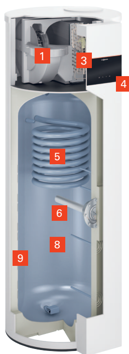
Vitocal 262-A, typ T2H-R290

Wariant elektryczny z grzałką elektryczną dla zastąpienia elektrycznego podgrzewacza c.w.u. lub pracy równoległej z grzewczą pompą ciepła