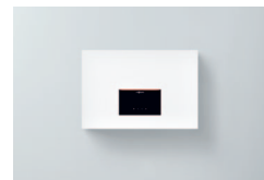
Vitocal 262-A moduł wiszący typ T2W-R290