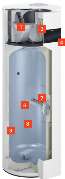
Vitocal 262-A, typ T2E-R290

Wariant elektryczny z grzałką elektryczną dla zastąpienia elektrycznego podgrzewacza c.w.u. lub pracy równoległej z grzewczą pompą ciepła